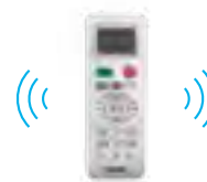
STEROWNIK BEZPRZEWODOWY YR-HE (STANDARD)